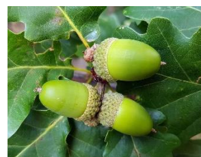
Owoce dębu szypułkowego