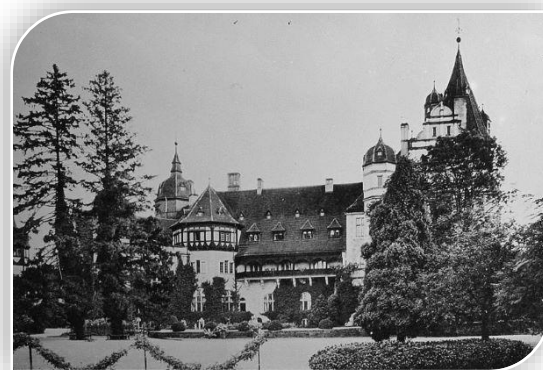
Zamek w Przemkowie